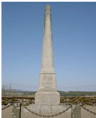
Minnesmärket vid Lena